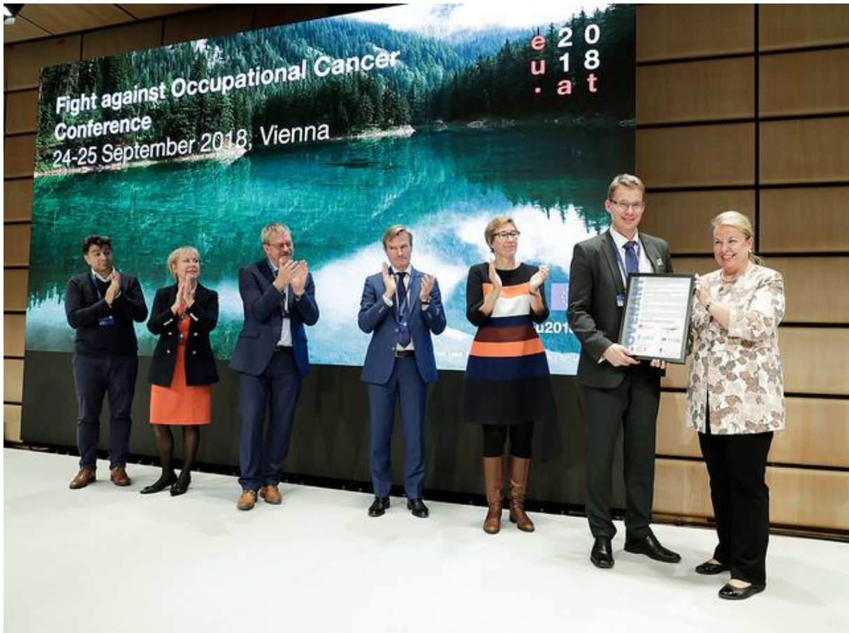
Bild 1: Frau Bundesministerin Hartinger-Klein bei der Übergabe der Roadmap an den finnischen Generaldirektor Raimo Antila

Von 24.-25. September 2018 wurde eine tripartive Fachkonferenz abgehalten, in deren Rahmen namhafte Expertinnen und Experten, Praktiker und politisch Verantwortliche den aktuellen Stand der Forschung präsentierten und neue Ansätze im Umgang mit gefährlichen Arbeitsstoffen diskutierten.