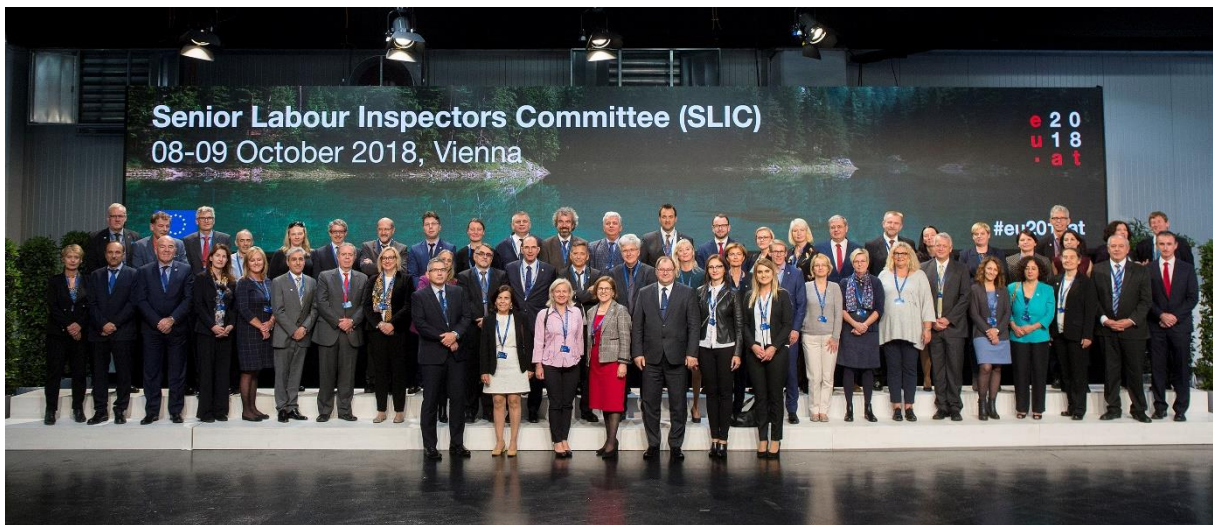
Bild 2: Familienfoto der Teilnehmer beim Thematischen Tag des Ausschusses Hoher Arbeitsaufsichtsbeamter (SLIC) am 9. Oktober 2018 in Wien

Die halbjährliche Sitzung des Ausschusses Hoher Arbeitsaufsichtsbeamter (SLIC) fand von 8.-9. Oktober in Wien statt. In dieser Zusammenkunft der europäischen Arbeitsinspektionen werden verschiedenste Themen zu Verbesserung und Harmonisierung der Arbeitsaufsicht in Europa behandelt. Teil dieser Veranstaltung war auch ein Thementag, der die Prävention arbeitsbedingter Krebserkrankungen zum Schwerpunkt hatte.