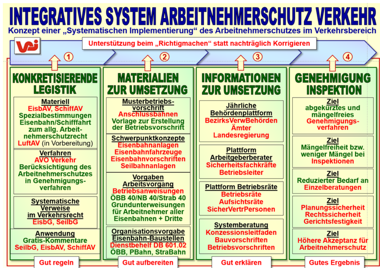
Bild 6: Schematische Darstellung des „Vier-Säulen-Modells“ (Konzept einer „Systematischen Implementierung“ des Arbeitnehmerschutzes im Verkehrsbereich)

4. Im Rahmen der vierten Säule sollen schließlich die strategischen Zielvorstellungen des „Vier-Säulen-Modells“ als Ergebnis der ersten drei Säulen erreicht werden – nämlich insbesondere vereinfachte und beschleunigte Genehmigungsverfahren, weniger festgestellte Mängel bei Kontrollen sowie weniger Bedarf an Einzelberatungen. Insgesamt sollen mit diesem Modell die Planungssicherheit und Rechtssicherheit sowie die Akzeptanz des Arbeitsschutzes im Verkehrsbereich erhöht werden.