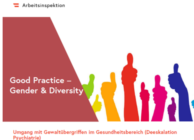
Bild 3: Grafik Deckblatt Leitfaden „Good Practice – Gender & Diversity“

Nähere Informationen finden sich auf www.arbeitsinspektion.gv.at unter „Schwerpunkte der Arbeitsinspektion/Menschengerechte Arbeitsplätze durch Anwendung von Gender und Diversity im Arbeitsschutz“.