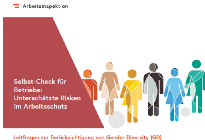
Bild 4: Grafik Deckblatt Leitfaden „Selbst-Check für Betriebe: Unterschätzte Risiken im Arbeitsschutz“