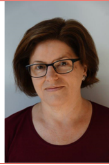
Dr. in Brigitte Zarfl Bundesministerin für Arbeit, Soziales, Gesundheit und Konsumentenschutz