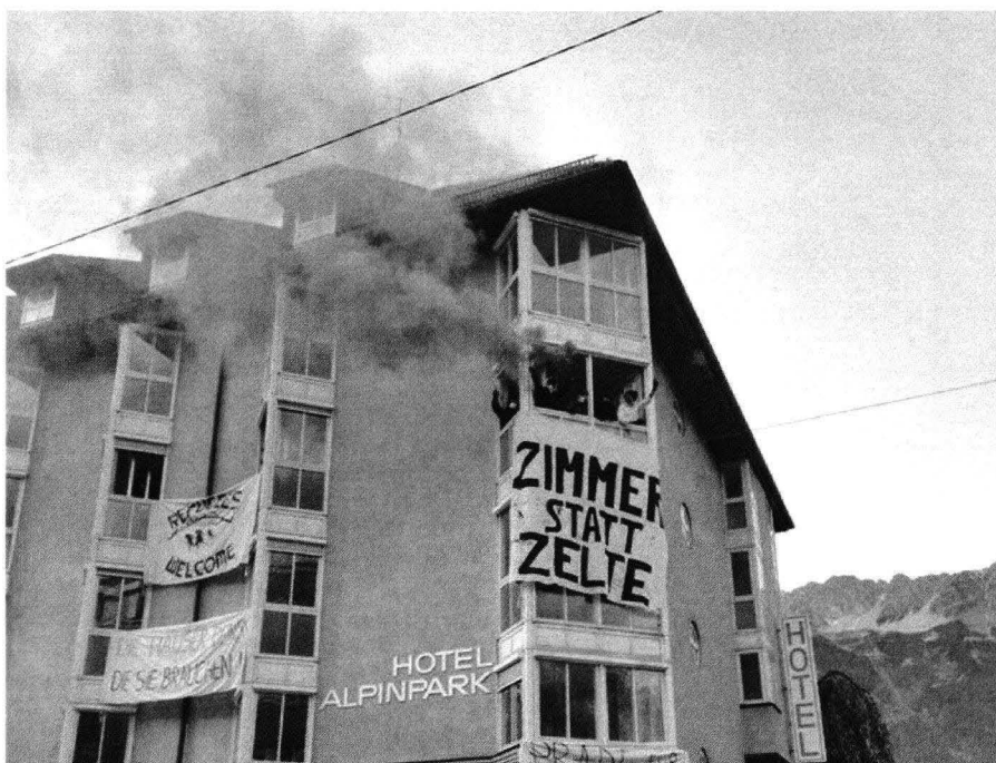
Abbildung 1: Hausbesetzer kritisieren österreichische Asyl- und Flüchtlingspolitik.

INNSBRUCK. Die Hausbesetzer „Pradl für alle!“ fordern leerstehenden Wohnraum in Tirol zu öffnen und jenen zugänglich machen, die ohne Zuhause sind oder in miesen Verhältnissen wohnen müssen. Die friedliche Besetzung wurde vom Eigentümer mit "Humor" aufgenommen. Die Besetzung "Pradl für alle!" will leerstehenden Wohnraum öffnen und jenen zugänglich machen, die ohne Zuhause sind oder in miesen Verhältnissen wohnen müssen: "Denn Tirol hat Platz. Zelte, Baracken, Container oder Lagerhallen sind kein Zuhause!", erklären die Hausbesetzer in einer Aussendung.