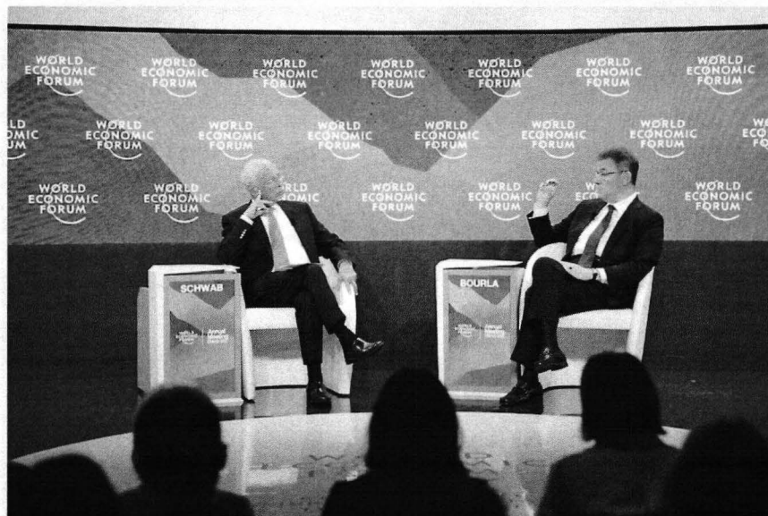
Am WEF in Davos stand der Pfizer-CEO Albert Bourla (rechts) im Mai 2022 Klaus Schwab Rede und Antwort. Vor dem EU-Covid Ausschuss hingegen erschien Bourla nicht – obwohl Pfizer viele Milliarden an Steuergeldern aus der EU erhalten hat.

HOME ÜBER UNS POLITIK WIRTSCHAFT GESELLSCHAFT GESUNDHEIT UMWELT BILDUNG FRAUEN