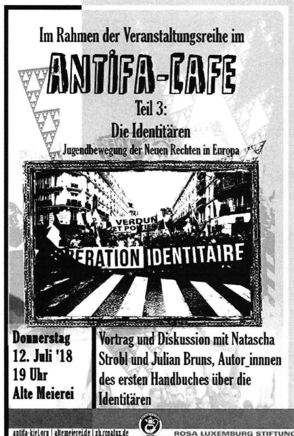
Abbildung 3: Einladung zum Vortrag Natascha Strobl und Julian Bruns durch die Antifa

linksextremen autonomen Szene beobachtet wird. Strobl hat auch gute Kontakte zur „Antisexistischen Aktion“ München und war im Dezember 2021 zu Gast. 17