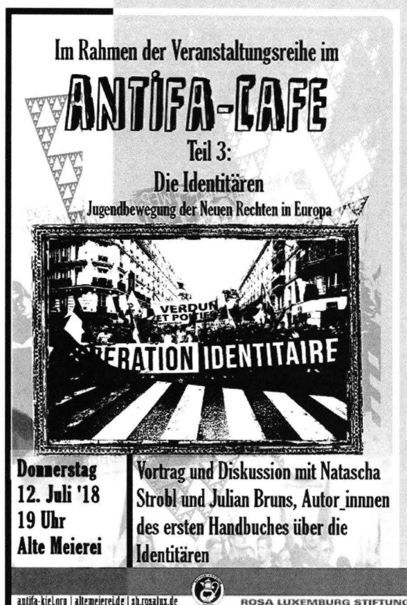
Abbildung 3: Einladung zum Vortrag Natascha Strobl und Julian Bruns durch die Antifa

linksextremen autonomen Szene beobachtet wird. Strobl hat auch gute Kontakte zur „Antisexistischen Aktion“ München und war im Dezember 2021 zu Gast. 17