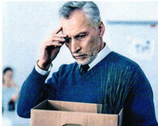
AK fordert abschlagsfreie Pension für alle, die 45 Jahre gearbeitet haben.

Damit beschäftigte sich auch ein Antrag der Salzburger Kammer-