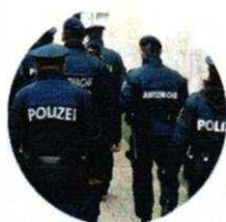
Bürgerinitiative - Justizwache und Strafvollzug @bijustizwache

Die Bürgerinitiative "Wirindexekutive" (39/BI) betreibt auf Facebook einen auffälligen Medienauftritt. https://www.facebook.com/bijustizwache/?epa=SEARCH_BOX