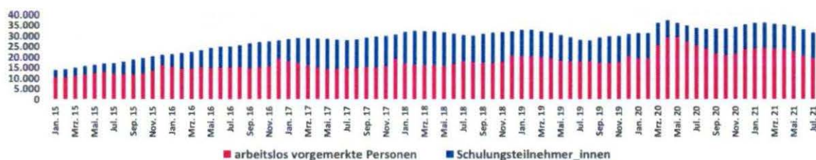
Abbildung 1: Bestand anerkannter Flüchtlinge und subsidiär Schutzberechtigter beim AMS zum jeweiligen Stichtag (AL und SC)

vorgemerkte Personen aus, sondern stellt auch einen wichtigen Zugang zu Schulungen dar. Alleine durch diese übernimmt das AMS einen Beitrag zur Integration und bietet beispielsweise Deutschkurse oder Unterstützungsleistungen dar. Mit dem mangelnden Zugang zum AMS, wird auch der Zugang zu diesen Integrationsmaßnahmen behindert, was funktionierender Integrationspolitik widerspricht.