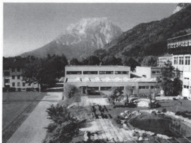
Abbildung 4: BRG/BG Stainach