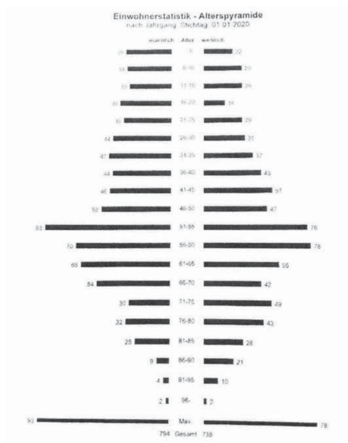
Abbildung 1: Alterspyramide

Der Ort Selzthal hat 1.532 Einwohner (Stand 01.01.2020). Das Durchschnittsalter von Selzthal beträgt gerundet um die 48 Jahre. Davon sind rund 15% der Bevölkerung, also 236 Einwohner unter 21 Jahre (siehe Abbildung 1 ). Im schulpflichtigen Alter befinden sich um die 8% der Kinder und Jugendlichen (124 Kinder). Während die Hälfte dieser Schulpflichtigen die Volksschule Selzthal besucht, haben die 10- bis 15-Jährigen die Wahl in das Stiftsgymnasium Admont (siehe Abbildung 2 ), das BRG/BG Stainach (siehe Abbildung 4 ) oder in die Hauptschule Rottenmann zu gehen. Im Alter von 16 Jahren gibt es zusätzlich die Möglichkeit in der Nähe die HTL Trieben (siehe Abbildung 5 ), BHAK/BHAS Liezen (siehe Abbildung 3 ), BAFEP Liezen, CARITAS Schule in Rottenmann oder die Polytechnische Schule in Rottenmann zu besuchen. Entscheidet man sich hingegen für eine Lehre, sind natürlich noch weitere Berufsfelder offen und auch eine Lehre mit Matura nicht ausgeschlossen.