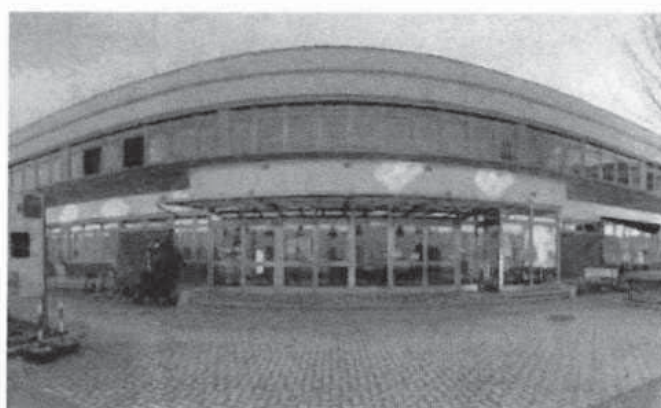
Abbildung 3: BHAK/BHAS Liezen