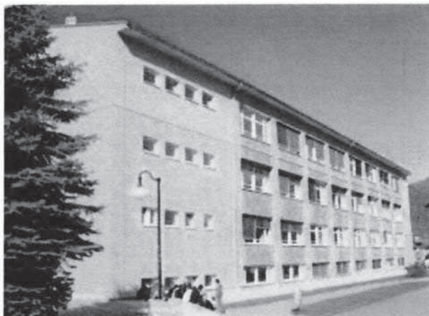
Abbildung 5: HTL Trieben