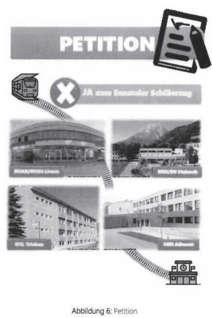
Abbildung 6: Petition

Gesäuse wiederbelebt werden, da im Moment nur sonntags ein Personenzug auf dieser Strecke fährt. Mit der Einführung des Schülerzuges könnte dies außerdem wieder mehr Schüler der Volksschule nach Admont locken, da man aufgrund der guten Verbindungen auch noch genügend Freizeit nach der Schule zur Verfügung hat. Darum wird eine Petition unter dem Namen Schülerzug Ennstal gestartet, um diese Verbindung zu ermöglichen. Mit der Unterzeichnung dieser Petition rückt die Realisierung des Schülerzuges für Admont Stück für Stück näher.