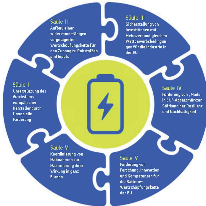
Abbildung 1. Die sechs Säulen der Batterie-Booster-Initiative