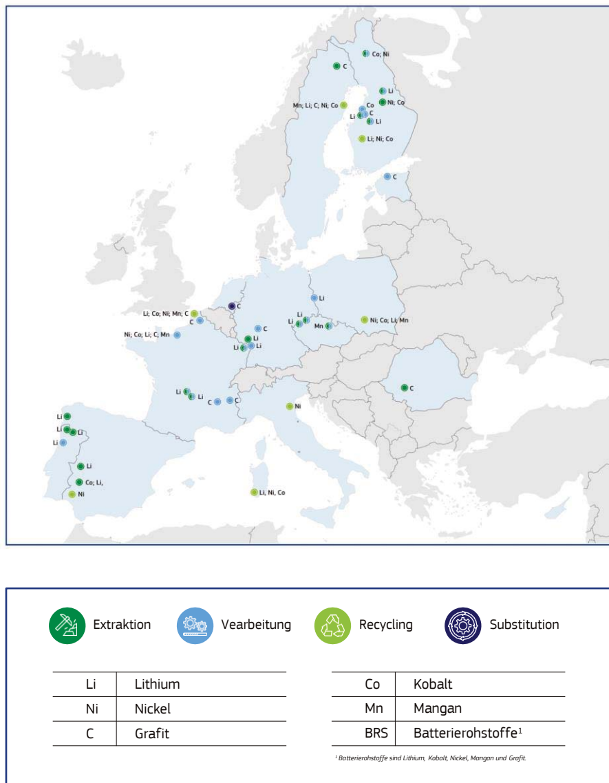
Abbildung 3. Strategische CRM-Projekte im Bereich Batterien

Um eine diversifizierte Beschaffung von Batterierohstoffen zu beschleunigen, hat die Kommission außerdem den Aktionsplan REsourceEU verabschiedet, mit dem in den nächsten 12 Monaten EU-Mittel in Höhe von 3 Mrd. EUR mobilisiert werden, um die CRM-Wertschöpfungskette direkt zu unterstützen.