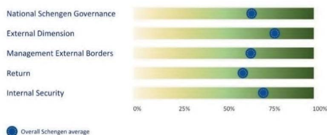
Aggregiertes Scoreboard vom Dezember 2025

Das Schengen-Scoreboard 2025 60 zeichnet ein unterschiedliches Bild davon, wie die Mitgliedstaaten zum Funktionieren des Schengen-Raums beitragen: