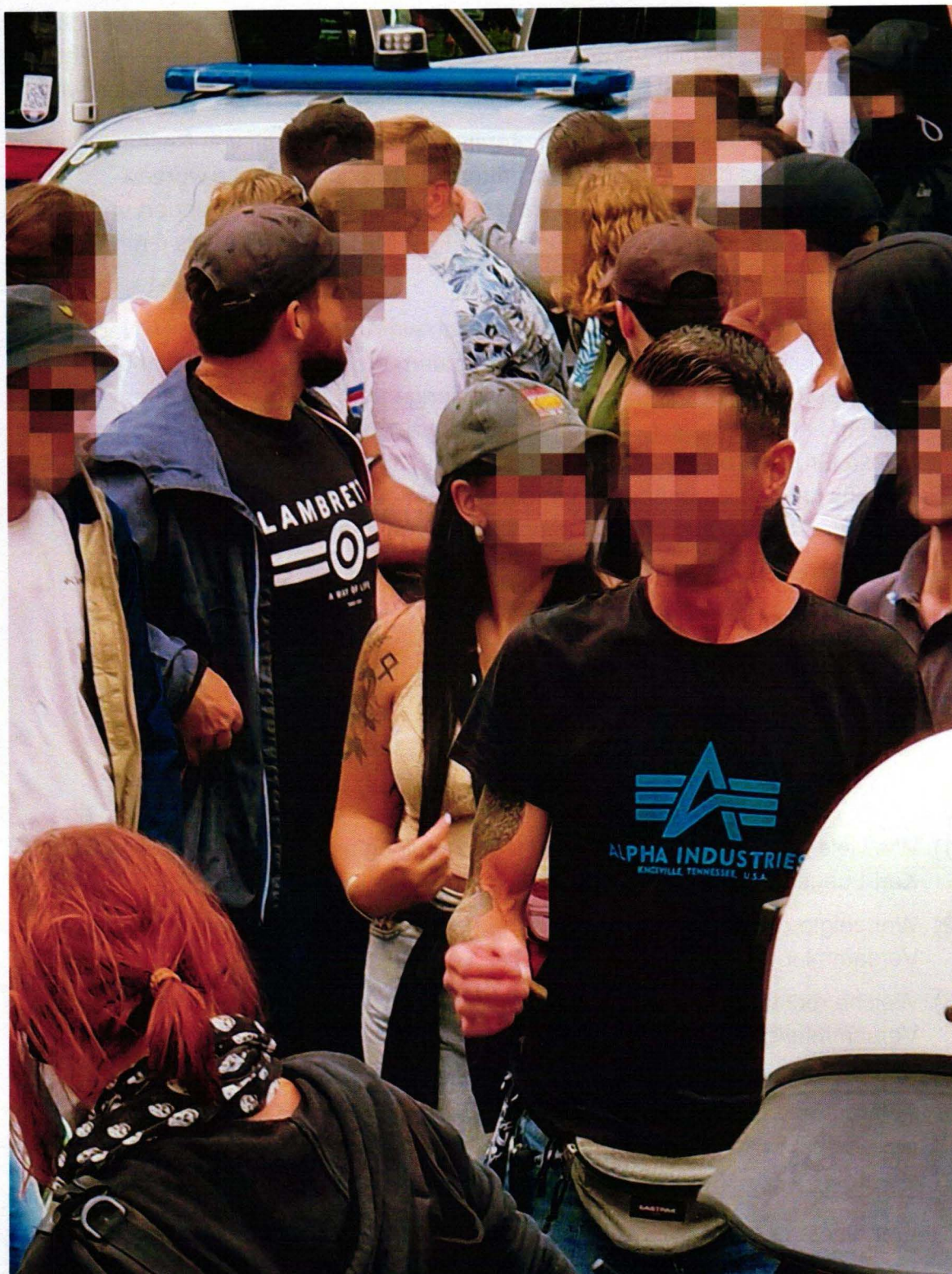
Eine Teilnehmerin des rechtsextremen Aufmarsches trägt offen eine Odal-Rune zur Schau, die auch durch die Hitlerjugend verwendet wurde und in Österreich verboten ist.