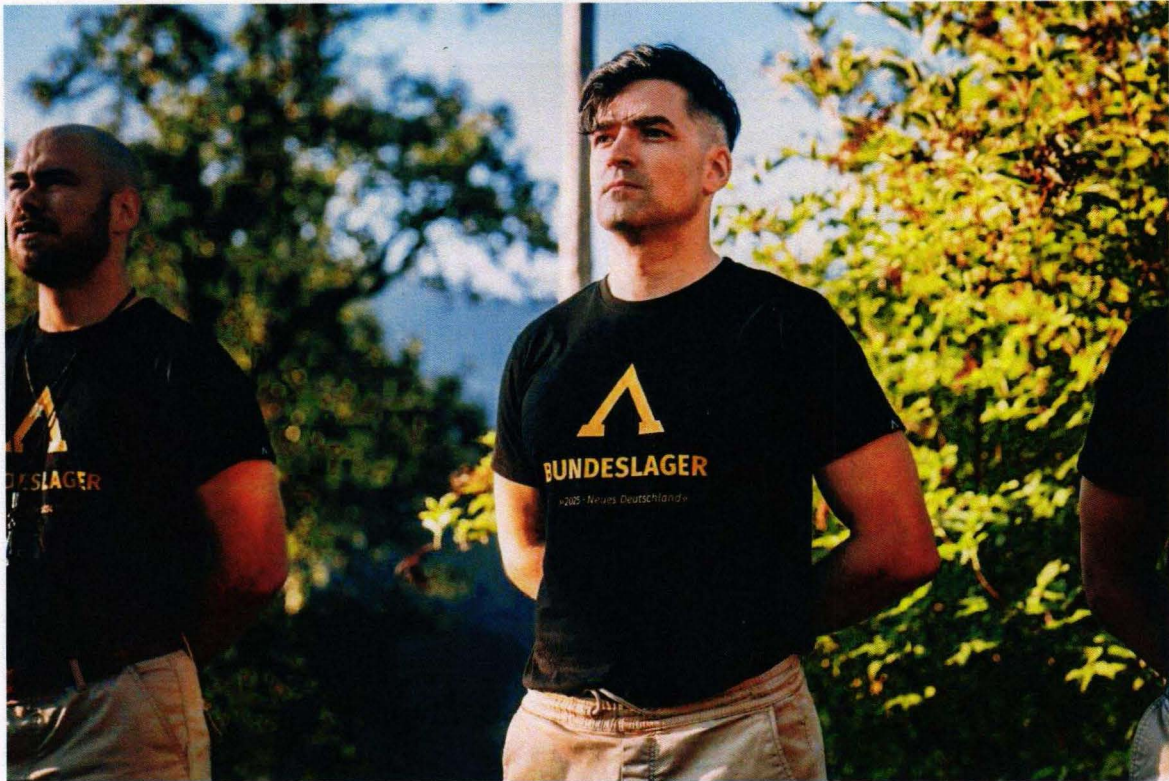
Martin Sellner von der „Identitären Bewegung Österreich“ als Teilnehmer des Sommerlagers 2025. Auf dem T-Shirt das deutschnationale Motto der Veranstaltung in den österreichischen Alpen: „Neues Deutschland“.

Dass das rechtsextreme Ausbildungslager unbehelligt von den Behörden in Österreich stattfinden konnte, wirft einige Fragen auf, die auch von sicherheitspolitischer Relevanz sind. Österreich darf sich jedenfalls nicht zum Tummelplatz für Rechtsextreme entwickeln, die hier ihren Gewaltfantasien freien Lauf lassen können.